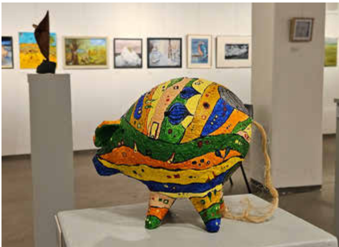
Foto: Blick in die 5. Laienkunstausstellung, 2026

Insgesamt 107 Hobbykünstlerinnen und Hobbykünstlern aus dem Landkreis Rostock präsentieren je eines ihrer Kunstwerke. Die eingereichten Arbeiten zeigen Stillleben, Porträts, Pflanzen- und Landschaftsbildnisse, Momentaufnahmen von Menschen und Tieren, aber auch Experimentelles, Fantasievolles, Träumerisches und Kritisches. Auch die Vielfalt der Genres bzw. Techniken weiß mit Malerei, Zeichnung (analog und digital), Fotografie, Papierarbeiten, Kleinplastiken und einer Installation zu beeindrucken. Bis zum 11. April hat das Publikum die Chance, über die Preisträger/Preisträgerinnen abzustimmen. Die drei Werke mit den meisten Stimmen werden im Rahmen der Finissage am 12. April 2026 um 15:00 Uhr prämiert.